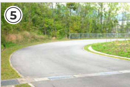
⑤ ここの下り急カーブに注意!