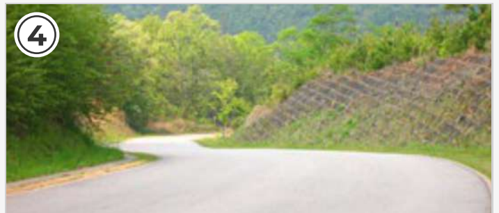
④ 下りのカーブが続く。コースアウトに注意!