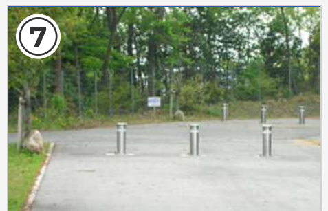
⑦ 当日は車止めを落としマットを敷きます。通過する際はご注意ください。