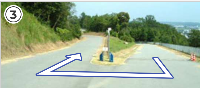
③ 上りきったら180°の急カーブ。