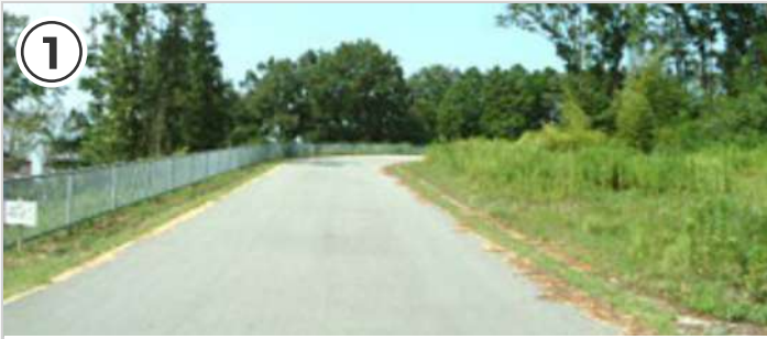
① スタート直後から上り坂。