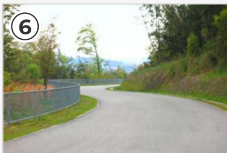
⑥ コース終盤はカーブが多め。